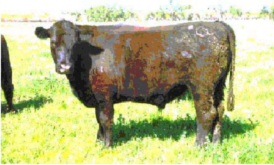
4.2 Animales rechazados